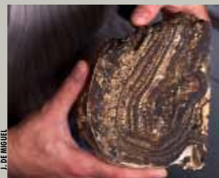
J. DE MIGUEL

Los estromatolitos se forman por cianobacterias que son fotosintéticas, lo que implica que haya luz. En la cueva, como es lógico, esa luz no existe, así que estos estromatolitos los han formado unas bacterias especia-