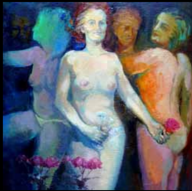
"A tu vera, a tu vera, siempre a la verita tuya, hasta que por ti me muera", de Emma García-Castellano. La autora explica que ha retomado una imagen clásica de la mujer, pero vista desde un punto de vista crítico. Es respuesta a frases como la que dijo León de la Riva: "No creo en las paridades, me parecen paridas".