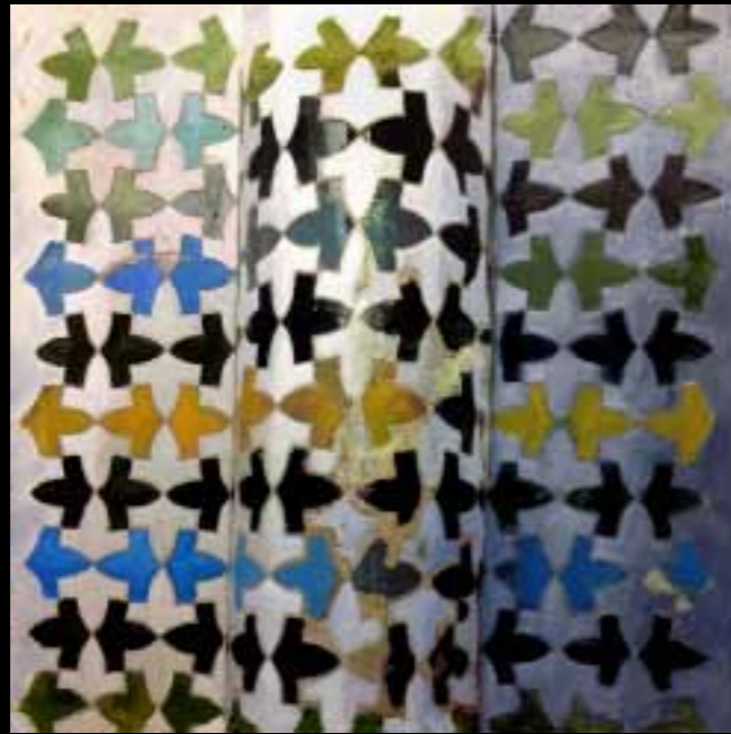
“Invisibles”, de Mareta Espinosa. La invisibilidad de la mujer es una realidad en muchos países. Aquí Espinosa ha querido reflejar ese estado en el mundo árabe debido a su cultura religiosa. La crítica de todos modos va más allá y llega hasta el mundo occidental donde la invisibilidad es también una lacra.