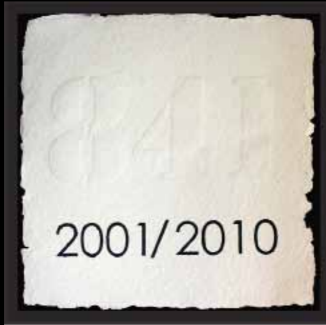
"841", de Sara Beiztegui. La autora decidió sintetizar el tema de la violencia contra las mujeres y los niños con un simple número, el 841 que hace referencia a los asesinados en el período comprendido entre 2001 y 2010. "El número está poco visible en la obra, y en la sociedad, y hay que acercarse mucho para verlo".