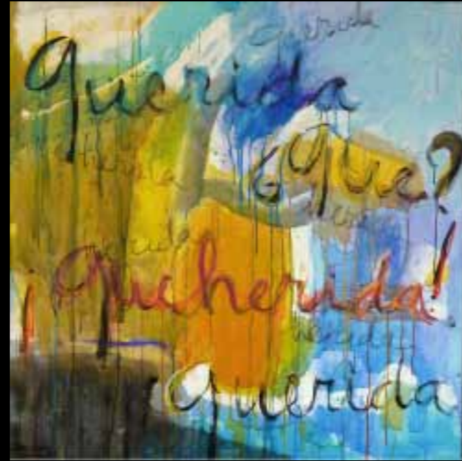
"Palabras en femenino", de Martina Dasnoy. La artista belga crea un cuadro en el que juega con las letras que forman la palabra querida y las convierte en qué y en queherida . En la parte baja del cuadro recupera de nuevo la palabra querida , "con la esperanza de que vamos a ir hacia adelante".