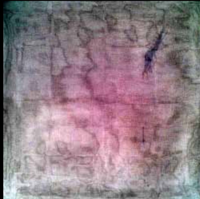
"La piel", de Ana Esther Balboa. Según la autora, en este cuadro se intuyen las heridas que están en el interior de la mujer maltratada. En la piel sólo se ve una ligera huella que va cicatrizando poco a poco. "Uno avanza en su vida, trata de olvidar las heridas, el dolor, pero estas dejan una huella en nuestro interior que permanece".